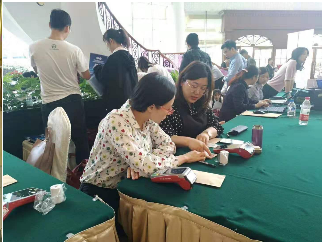
中国研究生院院长联席会2019年年会报到现场