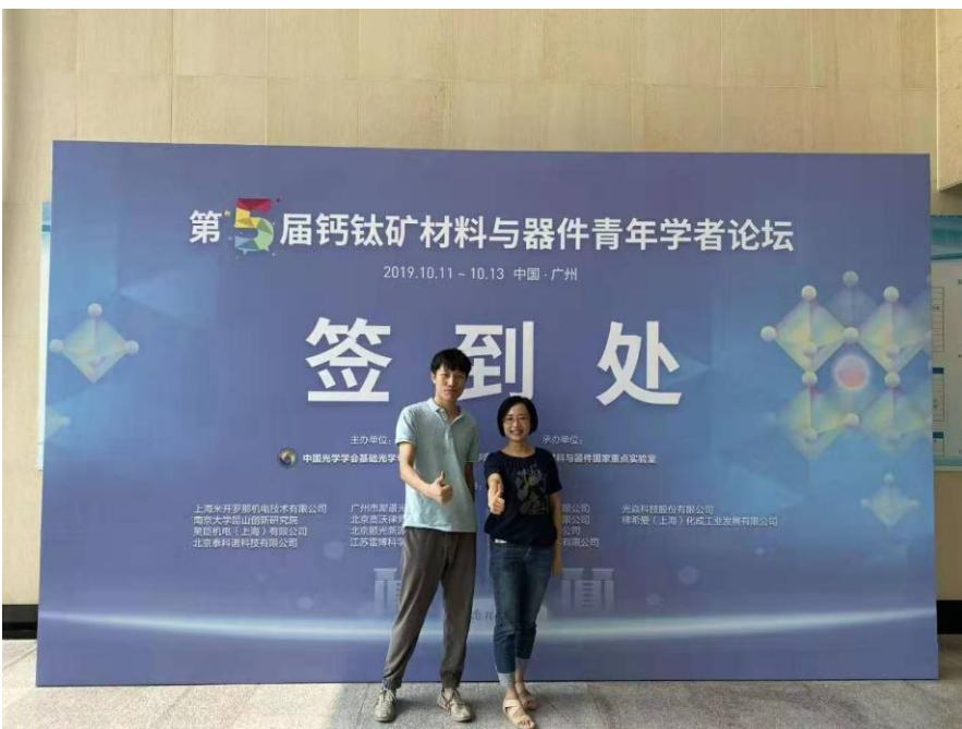
第五届钙钛矿材料与器件青年学者论坛 布场中