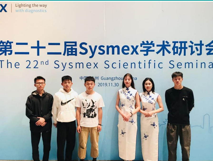
组织学生参加会议项目服务与运营