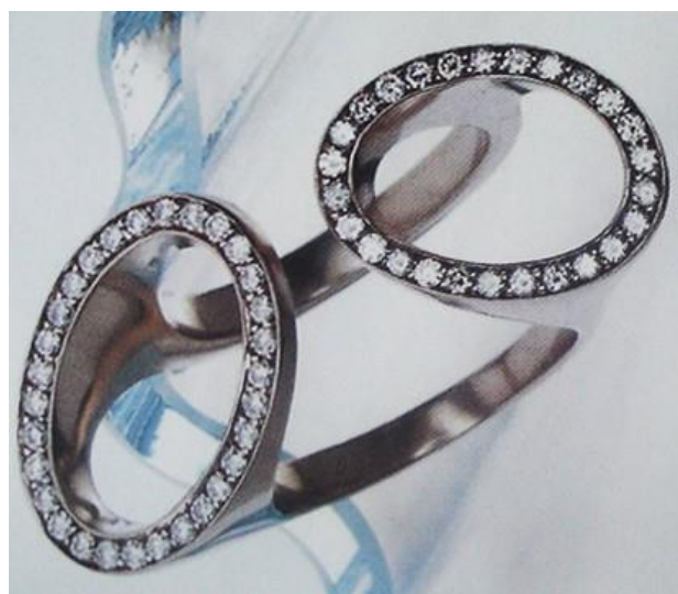
图 3：戒圈与戒面一体化

情况的让厂家的产品造成滞销，引起设计师们的重视，不得不寻找一下戒指设计的新路子。在这种种的原因下，设计师们就不再只是单单考虑到戒指的戒面设计，从而拓展到戒肩、戒圈等方面。而戒圈设计又有着比较大的创作空间，设计师们开始挖掘它，戒圈就由原来单一的“圆圈”形式发展到“多元化”结构，同时戒圈设计也使得戒面在视觉上能有意识地与人交流，不知不觉中给人带来享受，展现给人耳目一新的视觉形式感。例如图3的这款戒指设计，设计师先从戒圈下手，抛开了圆圈的戒圈的限制，运用了两个半圆的结构，拓展出带有镶嵌小碎钻的两个圆圈形态的戒面，丰富了戒面的数量，体现了戒圈与戒面一体化的设计风格，展示出具有造型特色的产品，加强了整个戒指的视觉效果。所以，戒圈从“圆圈”到“多元化”的设计思路所占比重在逐渐加大。