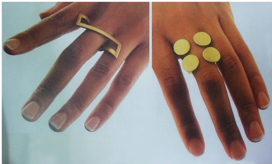
图 2：戒圈的多种艺术形态

戒指在民间广泛流行至今，人们对它的观念有所改变，使得当代戒指呈现多样的造型形态与风格形式，材料运用极为丰富，加工工艺前卫而独特，创作理念也有了大大突破。戒指所表达出来的或许是纯粹的美感，或许是自然的关怀，或许是一种思念，或许是社会时事的评论，或许是个人思想的表达……它，终于跳出装饰的框架与材料的限制，跻身艺术领域，享受更大的创作自由，展现给人们耳目一新的视觉形态。戒指的戒圈设计也跳出了“圆圈”的限制，跻身于多元化的形式发展，有了更多的创作空间，创造出更多的艺术作品、展示出更美的艺术形态（如图 2）。而种种的这些源于什么因素使之产生如此之大的变化？