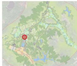
党建公共服务中心索引图