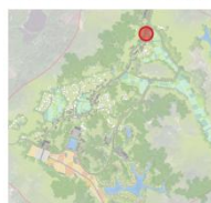
景区入口广场索引图