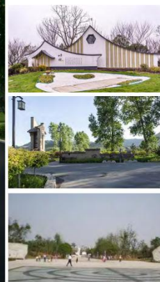
景区入口广场意向图