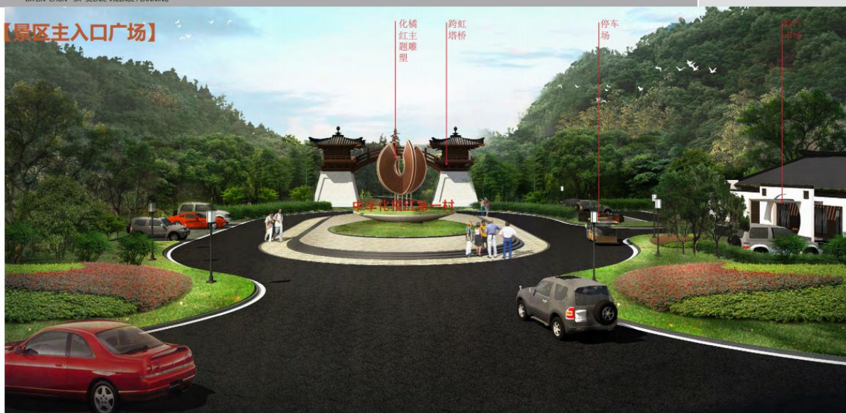
景区入口广场效果图