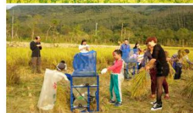
农耕体验园意向图