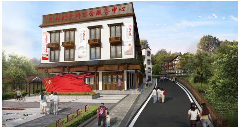
党建服务中心效果图