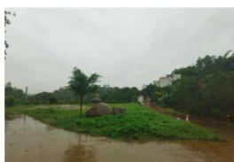
景区入口广场现状照片