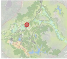
古村历史风情街索引图