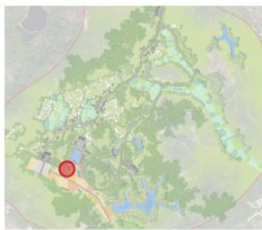
农耕体验园索引图