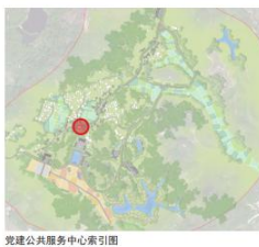
党建公共服务中心索引图